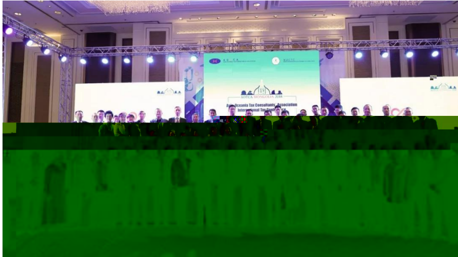
▲ 中税协代表团合影